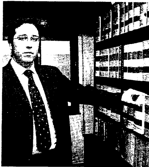
ABOGADO. Suárez ve pros y contras en el cambio legal. / R. G.

—¿Y sobre las uniones matrimoniales del mismo sexo? —Al haber crecido en una sociedad más liberal no me escandalizan este tipo de uniones. Comprendo que haya gente para la que el matrimonio sea un vínculo