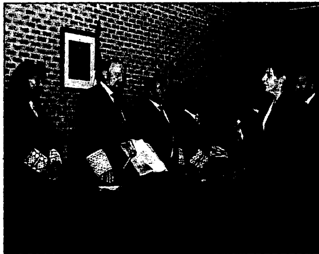
Una veintena de abogados juró o prometió antes de ingresar en el Colegio.