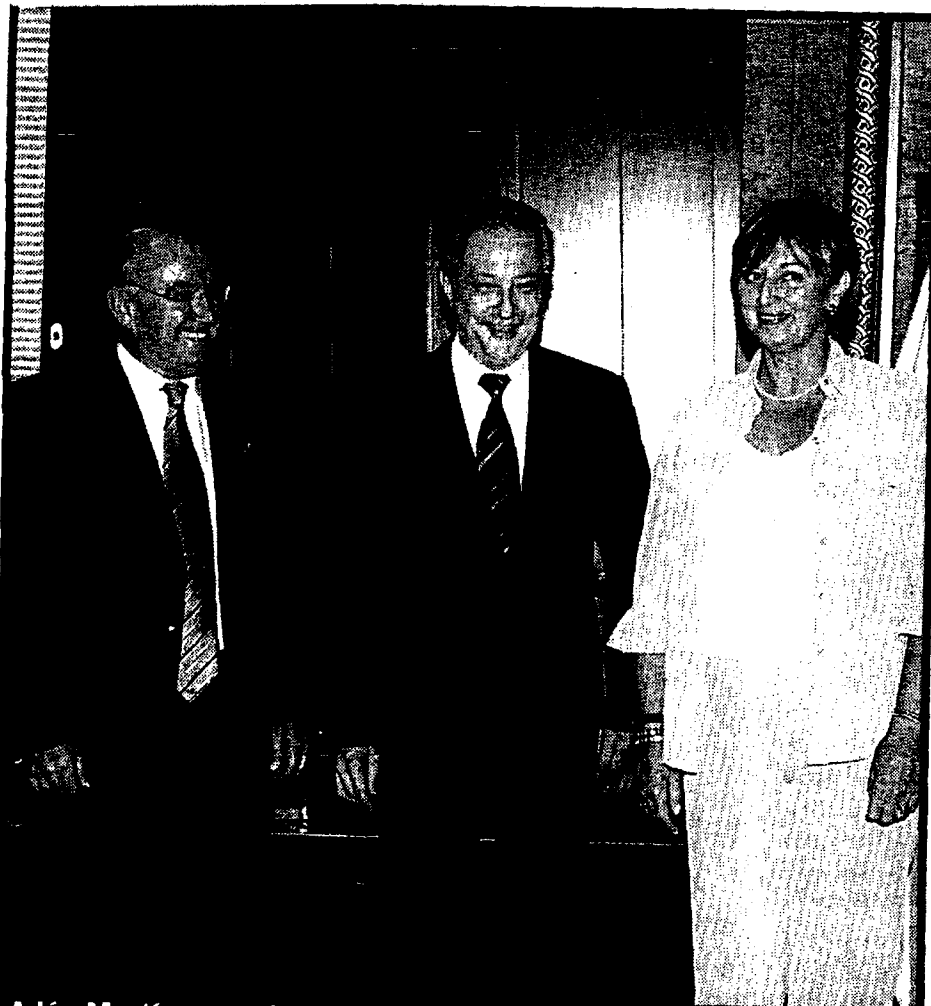
Adán Martín, con el presidente del Consejo General de la Abogacía