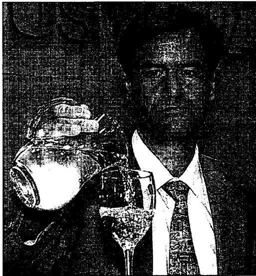
El ministro de Justicia, Juan Fernando López Aguilar, cuyo departamento ha llevado a cabo la reforma.

El nuevo texto legal incorpora además una novedad que permite que los estados adopten un sistema de administración monista o dual. Este último constituye una importante novedad en el derecho español, que se caracteriza por la existencia de un órgano de control o consejo de vigilancia y un órgano de dirección. Esta se-