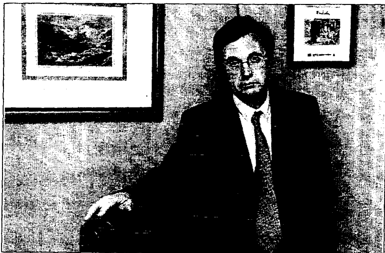
Félix Pantoja es vocal del Consejo General del Poder Judicial.

La ley 5/2000 reguladora de la responsabilidad penal del menor, pese a la denostada imagen que de ella percibe la sociedad, está cumpliendo básicamente sus objetivos, que no son otros que dar respuesta penal y sancionadora a los menores que cometen delitos tipificados en el Código Penal y que esa respuesta lleve incorporada la posibilidad de reinserción social de estos menores. Así lo ha afirmado, en rueda de prensa, el vocal del Consejo General del Poder Judicial (CGPJ), Félix Pantoja, quien ha expresado con rotundidad que "es falso que la ley cree espacios de impunidad y genere violencia juvenil". Asimismo, se-