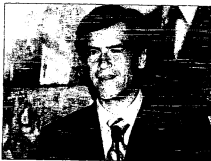
Juan Fernando López Aguilar, ministro de Justicia, pronunció ayer, en el Club Siglo XXI, una conferencia que versó sobre Justicia y Constitución Europea .

Los grandes retos a los que se refirió López Aguilar fueron la inmigración, el terrorismo, la igualdad de la mujer, los avances sociales y las estrategias globales, sostenibilidad, medio ambiente o la paz. En su opinión, "ninguno de ellos puede ser afrontado, ni mucho menos resuelto, en solitario desde los Estados de la nación". Aseguró que "sólo desde la definición de políticas comunes y desde el acuerdo podemos acumular la fuerza necesaria para enfrentar los desafíos de este siglo XXI".