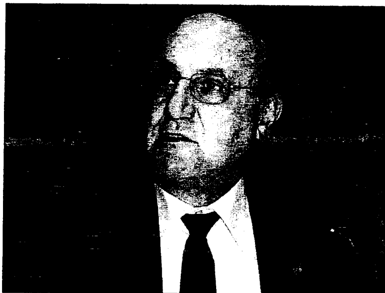
El presidente del Consejo General del Poder Judicial y del Tribunal Supremo, Francisco José Hernando.

Con la victoria, por mayoría absoluta, de la APM en las Salas de Gobierno del Supremo, la Audiencia Nacional y catorce de los diecisiete