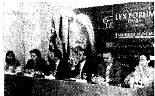
PARTICIPACIÓN. Los ponentes de la mesa redonda sobre la mediación como nueva salida profesional.

¿Quién está capacitado para ser mediador?. Precisamente este asunto se ha abordado en la mesa redonda que tuvo lugar esta mañana, moderada por el director general de Justicia y Menor de la