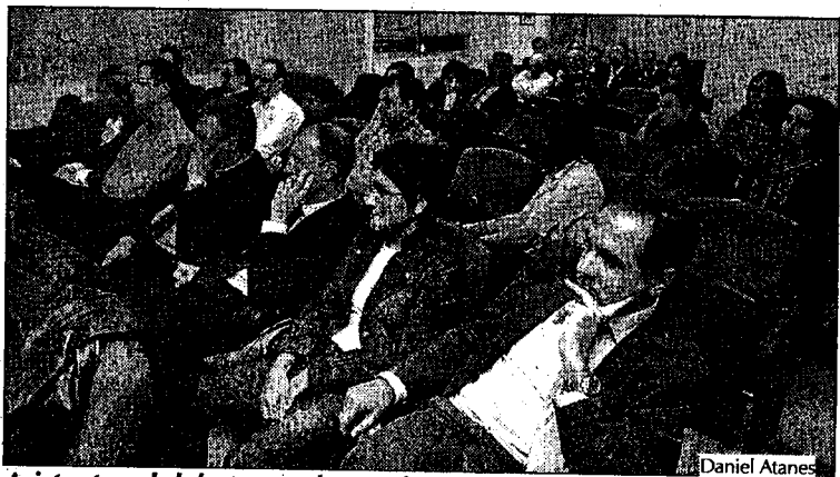
Asistentes al debate preelectoral.