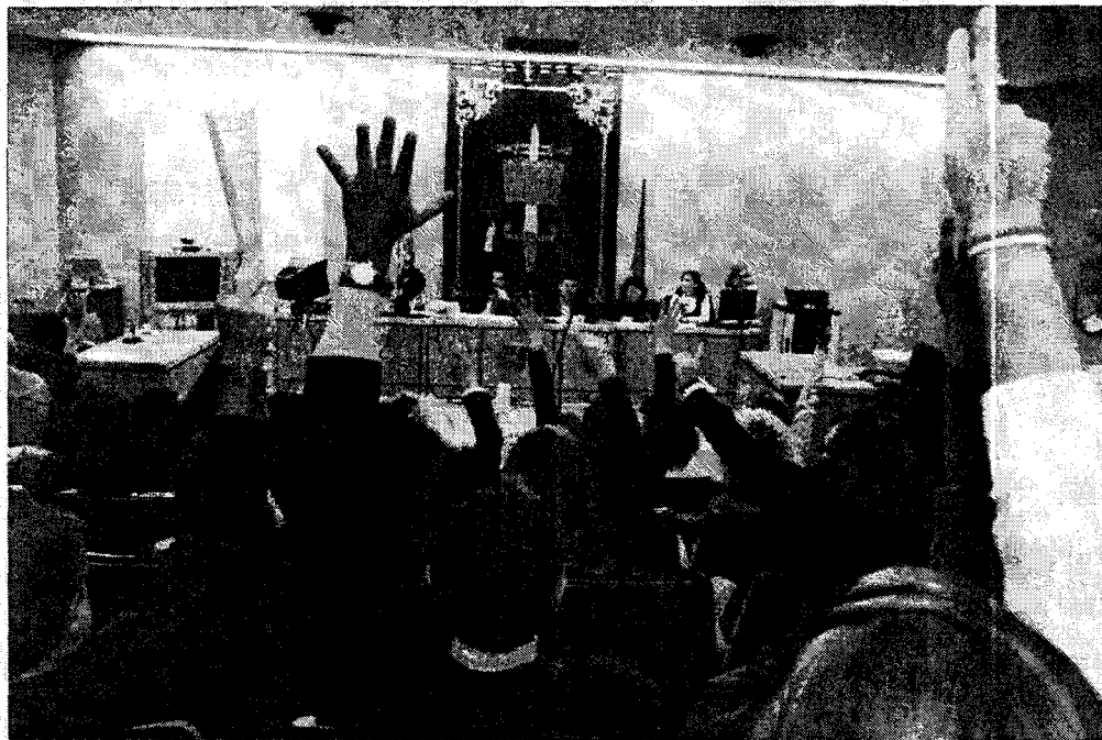
Votación de una convocatoria de huelga por un grupo de abogados del turno de oficio, el pasado mes de enero, en los juzgados de Plaza de Castilla.