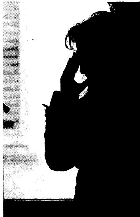
Una maltratada, en la penumbra de una casa de Alicante.