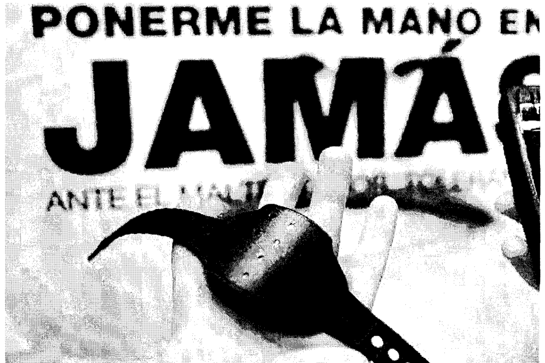
ALEJADOS. Una pulsera con GPS para colocársela a los maltratadores con el fin de que no se acerquen a sus parejas y garantizar que se

La víctima también cuenta con un sistema, similar a un teléfono móvil, que le permite la comunicación por voz y de datos con el centro de control, informa de su situación a través de un GPS y dispone un botón de pánico para casos de emergencia.