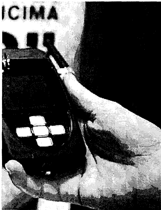
cumplan las medidas de alejamiento.

La entidad ha detectado también un incremento de adolescentes agredidas por sus parejas. Por ello, el mensaje de la campaña de este año, "Tú me importas. Yo doy la cara por las mujeres", incide en los jóvenes entre 16 y 35 años.