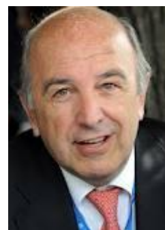
Joaquín Almunia, Comisario de Competencia y Vicepresidente de la Comisión Europea