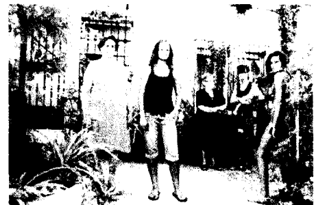
Pie de foto