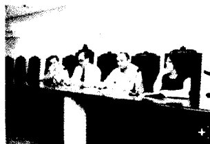
Los abogados se reunieron anoche en su reunión.