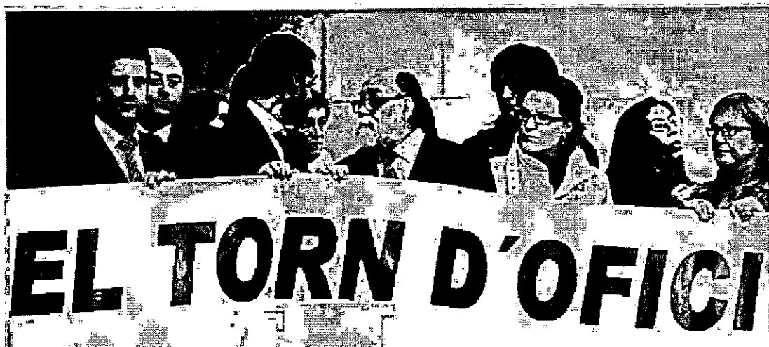
Protesta del turno de oficio este mismo mes en Valencia por los impagos.