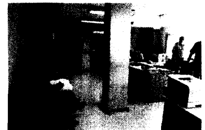
Un abogado de oficio repasa el expediente que le acaban de entregar en los juzgados de Cádiz. / NURIA REINA

Actividad usuarios Iniciar sesión REGISTRO Cerrar barra