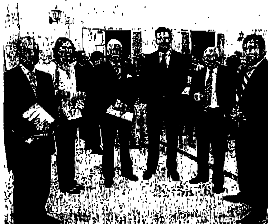
Jueces y fiscales arroparon a los abogados ayer.