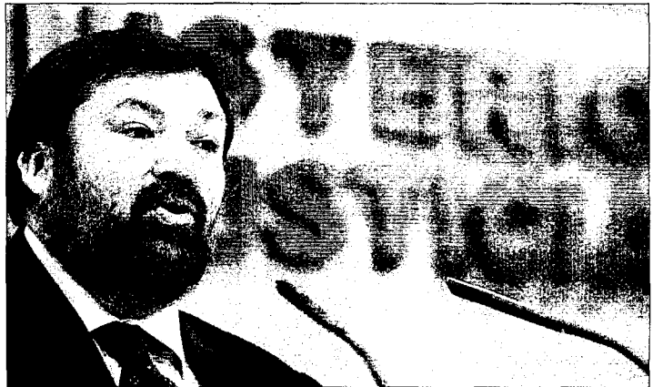
El ministro de Justicia, Francisco Caamaño.