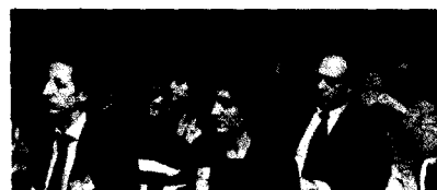
Letrados de Valladolid y de otras comunidades autónomas españolas, durante la jornada que se inició ayer en el Colegio de Abogados.