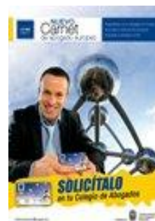
La Abogacía lanza un nuevo carnet de Abogado Europeo

La Comisión Europea ha adoptado una propuesta dirigida a modernizar la Directiva 2005/36/CE, relativa a las cualificaciones profesionales. Según se va reduciendo la población en edad de trabajar en muchos Estados miembros, se prevé que la demanda de trabajadores muy cualificados aumente de aquí a 2020 en más de 16 millones de puestos de trabajo. Si Europa quiere satisfacer esta demanda, habrá que colmar las lagunas de escasez de mano de obra, por ejemplo mediante profesionales móviles y bien cualificados de otros Estados miembros de la UE. Estos pueden ser una fuente fundamental de crecimiento, pero solo si pueden trasladarse con facilidad allí donde haya empleo, para lo cual es necesario que sus cualificaciones se reconozcan en la UE de forma sencilla, rápida y fiable. La propuesta tiene por objeto simplificar las normas sobre la movilidad de los profesionales de la UE gracias a una tarjeta profesional europea para todas las profesiones afectadas, la cual permitiría un reconocimiento más fácil y rápido de las cualificaciones. Además, aclara la normativa para los consumidores al instar a los Estados miembros a revisar el alcance de sus profesiones reguladas y al abordar las preocupaciones públicas sobre las competencias lingüísticas y la falta de alertas eficaces en materia de negligencia profesional, sobre todo en el sector sanitario.