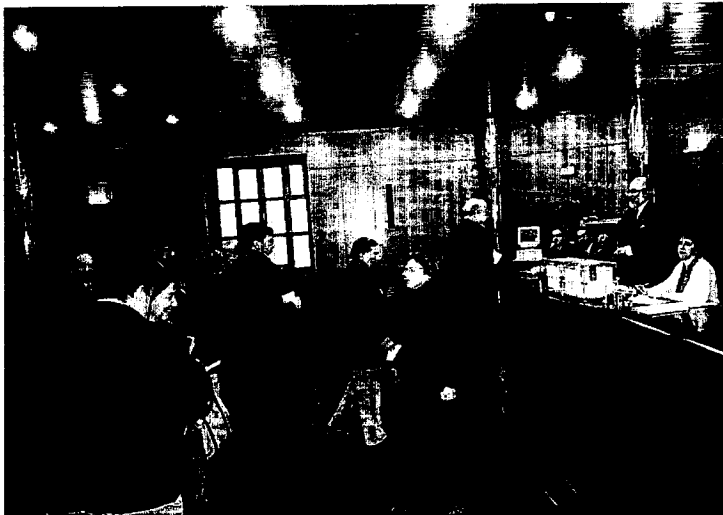
VOTACIONES. Las elecciones se celebraron en el salón de actos de Las Salesas. / SANE

Las urnas quedaron abiertas a las once de la mañana en el salón de actos del complejo judicial de Las Salesas y se cerraron a las seis de la tarde, después de una jornada electoral que discursó con normalidad. En esta ocasión, y a la espera de datos pormenorizados (el voto de los abogados ejercientes