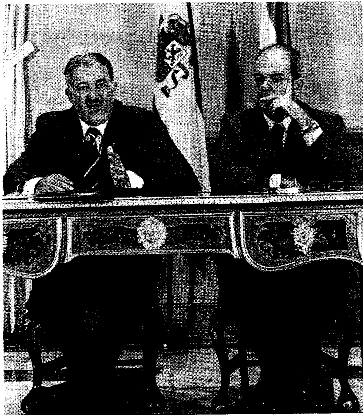
EXPLICACIÓN. Conde-Pumpido y Chaves, ayer.

La Junta y la Fiscalía General del Estado firman un convenio, en virtud del cual se crearán plazas para juristas, que llevarán de forma exclusiva estos casos