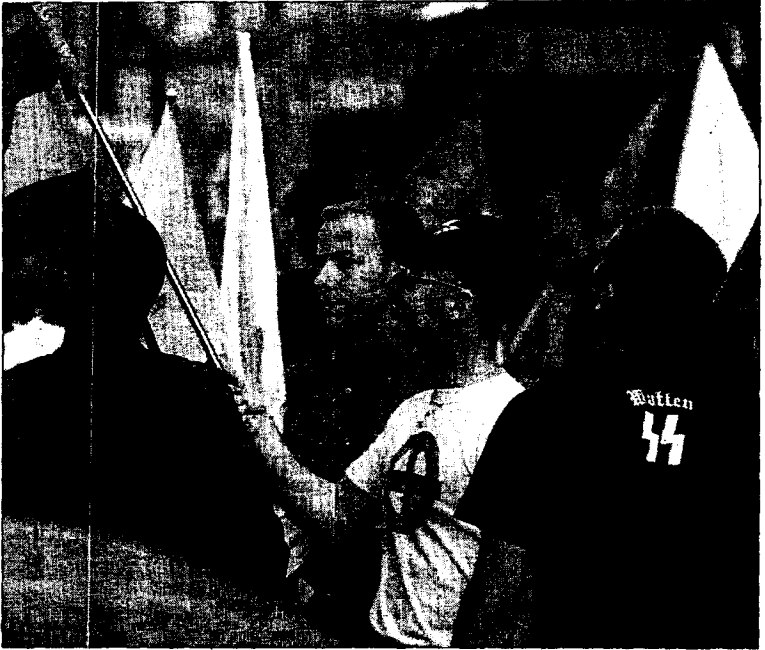
Manifestantes de España 2000 en una protesta contra la inmigración ilegal, el año pasado en Russafil.

Este periódico ha conocido de fuentes del caso que las «coincidencias» en cuanto a la descripción de los responsables de estos hechos de violencia apuntan a que los grupos de ultraderecha, en general, y del partido España 2000, en concreto, inculcados con