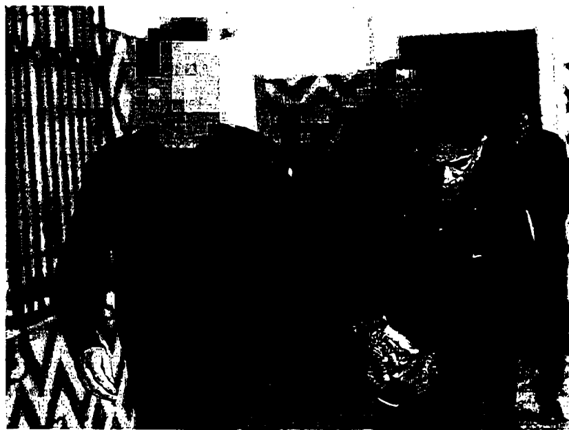
Acusados en la Audiencia de Zaragoza con el calabozo al fondo, que desaparecerá en 6 meses. J.C. ARCOIS