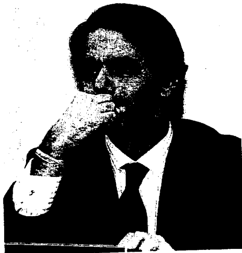
COMPARENCIA. Aznar protagonizó la última vista.

Reigada consideró que así «se volvió a descubrir una de las funciones de la prensa española».