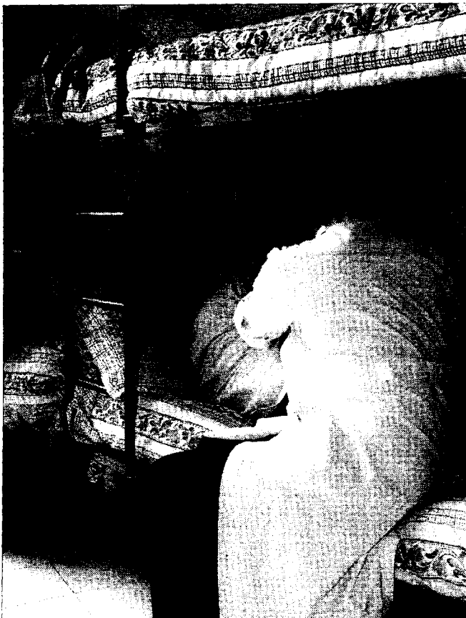
Dos mujeres maltratadas, en un piso de acogida de Valencia.