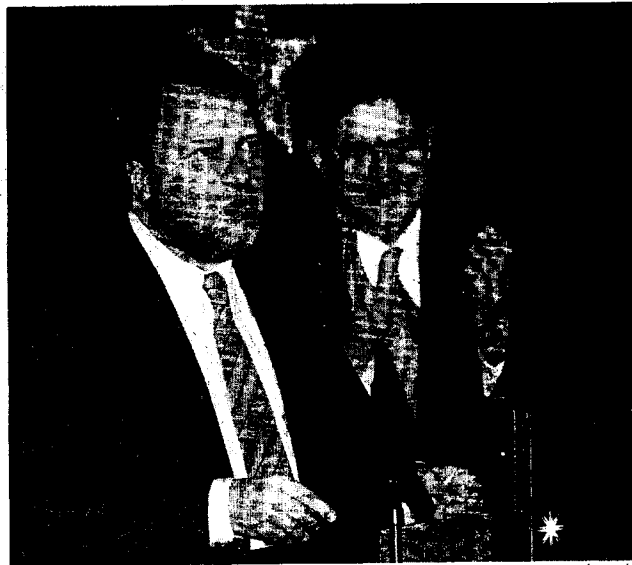
El alcalde y el decano, en el momento del anuncio de la distinción