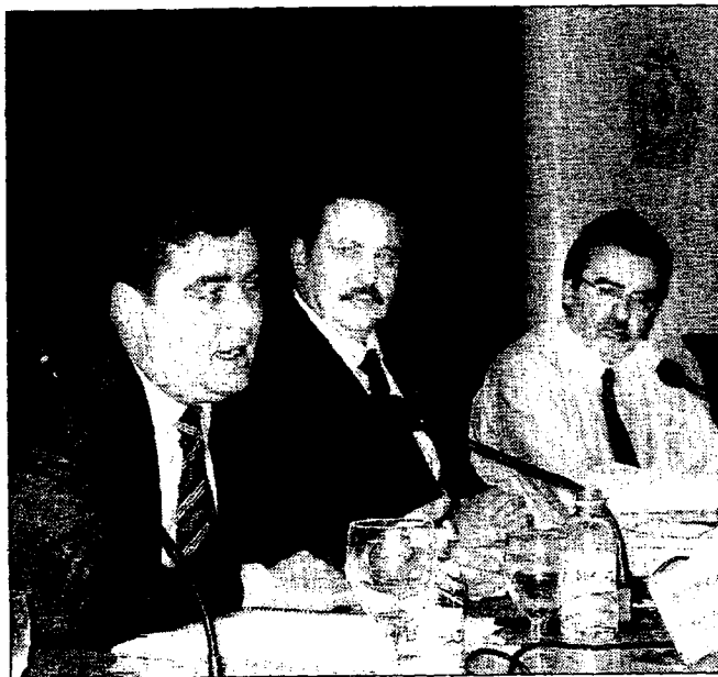
El juez Calatayud, ayer, durante su conferencia en el ICAV.

El juez Calatayud es muy conocido porque algunas de sus medidas impuestas en Granada a menores han sido objeto de especial tratamiento por los medios de comunicación. El juez Calatayud sentenció a un menor a limpiar cristales de edificios públicos por pegar a una persona que al parecer le «miró mal» o condicionar el cumplimiento de una pena por robo a que el joven aprobase su examen de ingreso en el Ejército.