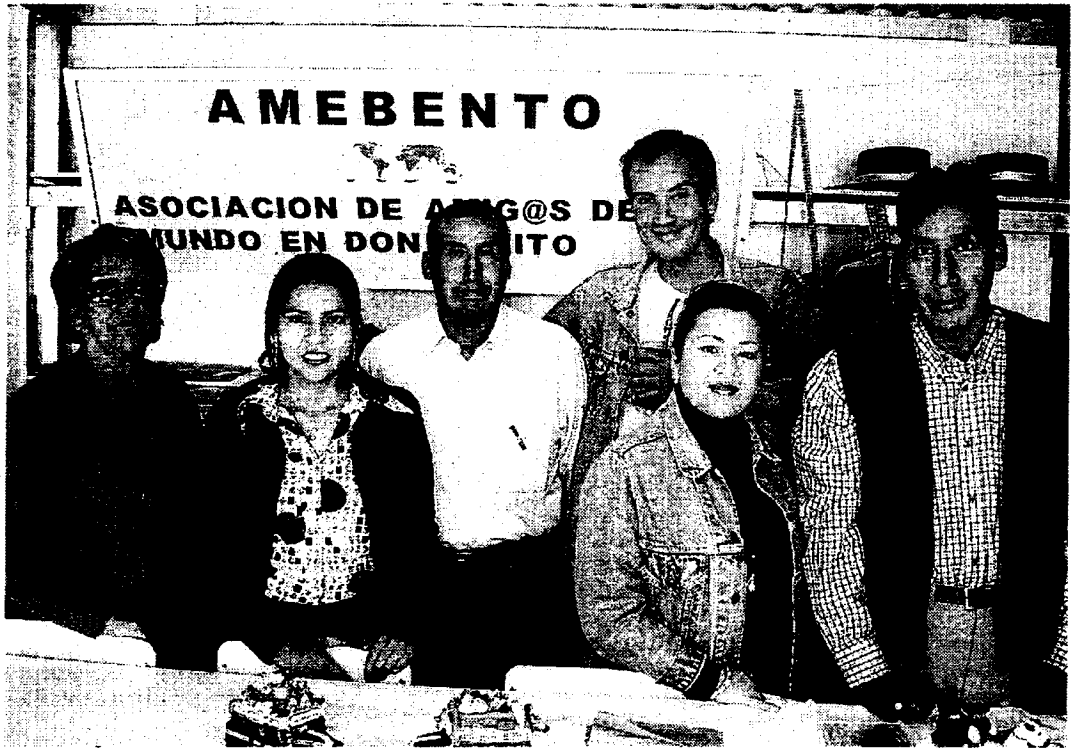
INMIGRANTES. Además del Colegio de Abogados, la asociación Amebento asesora a extranjeros. / R.