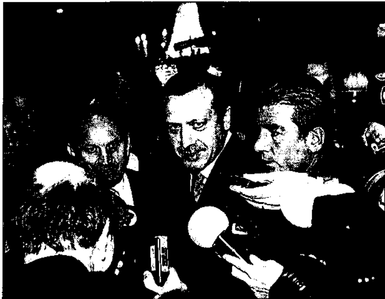
El primer ministro de Turquía, Recep Tayyip Erdogan, ayer en Bruselas.

Y aunque la población rural del centro y este de Anatolia sigue viviendo aún en condiciones de extrema pobreza, la economía turca parece haber superado ya la grave crisis de 2001, que estuvo a punto de arrastrar al país a la bancarrota, para entrar en un período de fuerte crecimiento, con un tasa que superará este año el 8% y la galopante