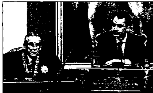
Francisco Rubio Llorente y Jose Luis Rodríguez Zapatero.

El Gobierno optó por no solicitar informe sobre dicha reforma al Consejo Ge-