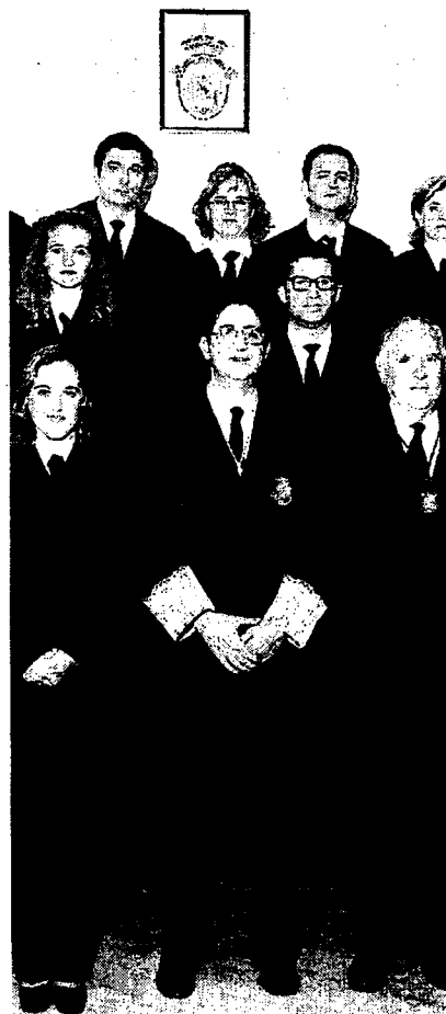
Una de las juras de nuevos abogados