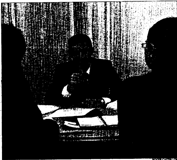
Advocat especialitzat en estrangeria en un despatx de Barcelona

En aquest sentit, Sánchez avança algunes xifres: «La mitjana d'assistència a immigrants ja és d'onze diàries, tant en el rebuig en frontera com en detencions per no tenir els papers en