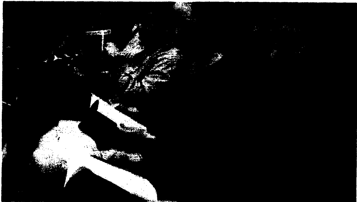
INTERESADOS. Los estudiantes ojean los ejemplares de la Constitución Europea.