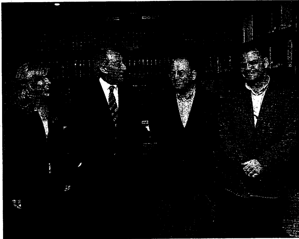
► Representantes del Colegio de Abogados y de las asociaciones, ayer en la entrega de las ayudas.

Este año las ayudas -de las que se hizo entrega ayer- se han concedido para el proyecto de la Asociación Inti-Rayny consistente en la dotación de tres aulas en un colegio de la ciudad peruana de Arequipa para unos 250 niños, y para el de Madreselva ONG para la creación de una escuela primaria en Zway (Etiopía). Estas organizaciones se repartirán 5.138,87 euros, que es la