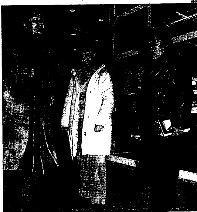
Los letrados pontevedreses entrando en la cárcel de A Lama

Este trabajo será de gran ayuda para la población reclusa, que en el interior del penal "se siente, no diré desasistida, pero a ellos