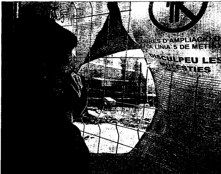
Una mujer observa tras una valla cómo las grúas derriban el edificio número 10 del pasaje de Calafell.

La piqueta derriba el edificio más afectado sin que muchos de sus 27 vecinos puedan recoger sus pertenencias