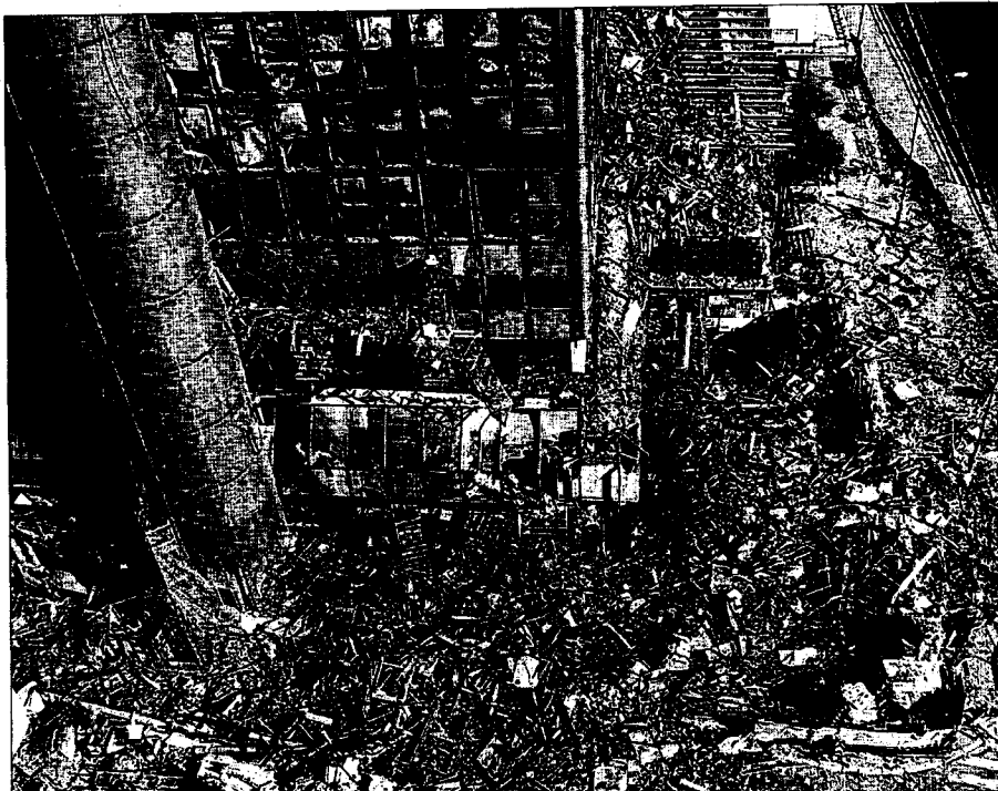
Toneladas de cristales, hierros y escombros a los pies del rascacielos incendiado.

Las empresas afectadas piden prórrogas para entregar auditorías y memorias mientras recuperan la información precisa para trabajar