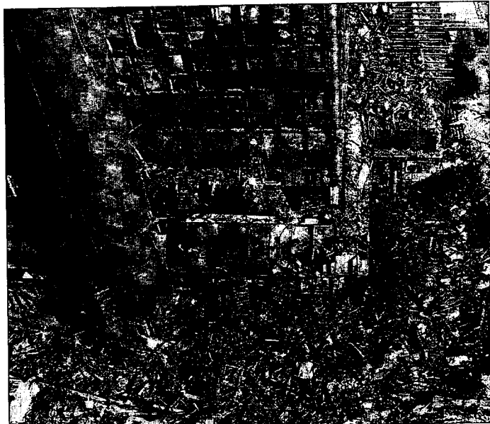
Escombros caídos del edificio Windsor donde estaban oficinas de Deloitte y Garrigues.