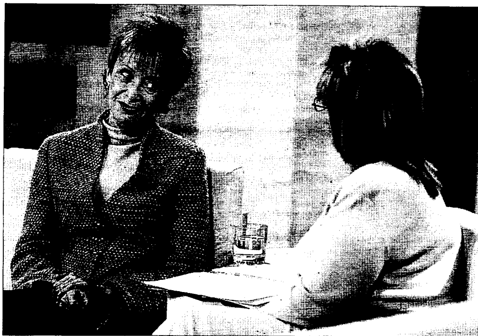
María Teresa Fernández de la Vega, ayer, durante la entrevista con María Teresa Campos en Antena 3.

Felipe González también terció ayer en la polémica. Para el ex presidente, la posición de los grupos críticos al proyecto de ley es un «desafío absolutamente ridículo» al Gobierno y auguró que «no du-