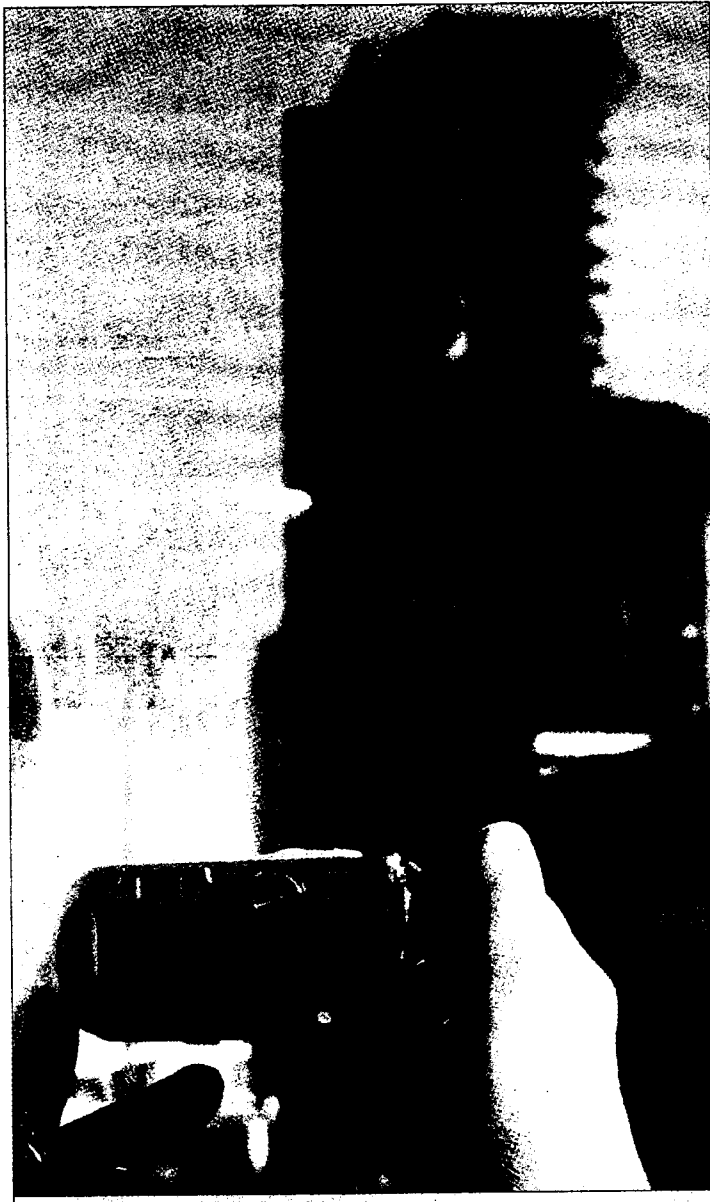
Una mujer fotografía los restos del edificio Windsor.

La demolición requerirá en torno a seis meses, porque tendrá que realizarse "muy poco a poco" para no poner en peligro a los edificios que se encuentran a su alre-