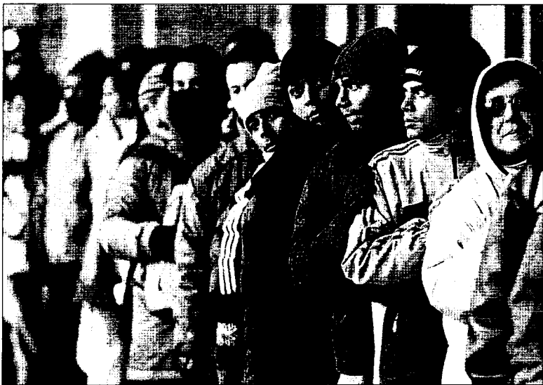
Numerosos inmigrantes volvieron a hacer cola ayer en la Junta de Distrito de la Plaza Mayor de Madrid.

Los datos del padrón también revelan que los ecuatorianos siguen siendo los inmigrantes más numerosos en nuestro país, seguidos de los