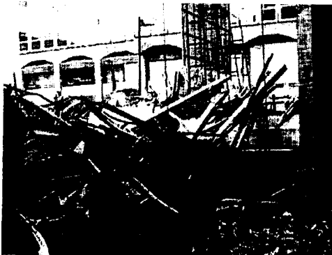
El interior del rascacielos, arrasado por las llamas

De momento, según fuentes judiciales y de los propios abogados, en los Juzgados y Tribunales de Madrid no se han producido un número mayor de suspensiones que antes del incendio.