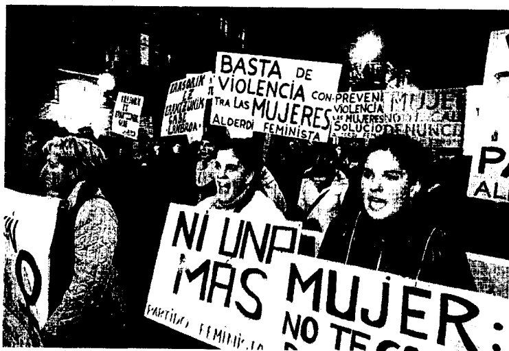
INDIGNACIÓN. Mujeres se manifiestan en Bilbao contra la violencia de género.

Las víctimas de los malos tratos, sin embargo, tienen que cumplir una serie de requisitos para que se les pueda asignar un terminal. De entrada, «no pueden convivir con la persona que les haya agredido. Además, deben dispo-