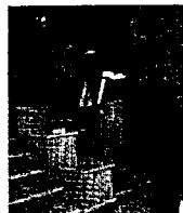
El proceso de la mediación intrajudicial