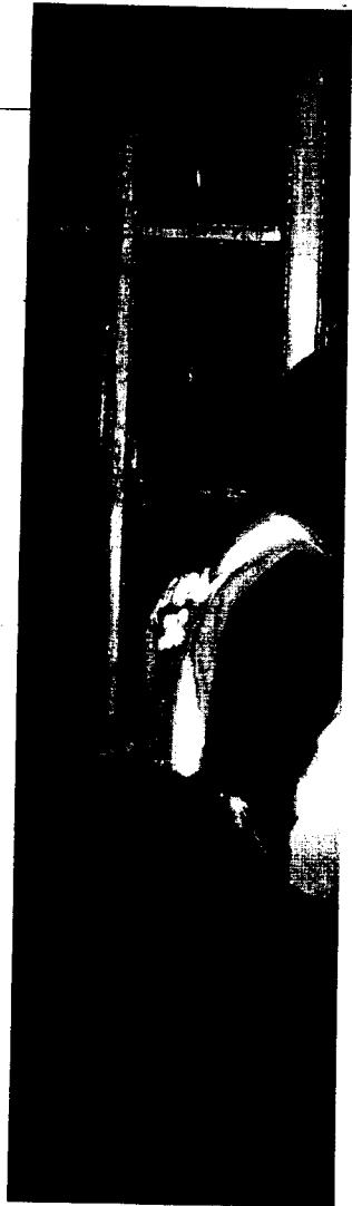
Agentes de la lucha antiterrorista, durante una op.