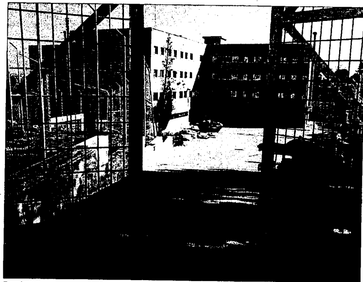
Entrada al reformatorio El Pinar, en la carretera de Colmenar Viejo.

► Athamira. La calificación que recibe es de "muy deficiente" en cuanto a la conservación de las instalaciones y el mobiliario. El comedor es tan pequeño que los 20 internos tienen que comer en tres turnos, lo que hace que los últimos reciban la comida fría. En la sala de convivencia, algunas sillas "han sido arrancadas de sus soportes, quedando éstos al descubierto". La pintura de la mayoría de las dependencias se encuentra manchada y el sistema de seguridad de las ventanas impide que puedan