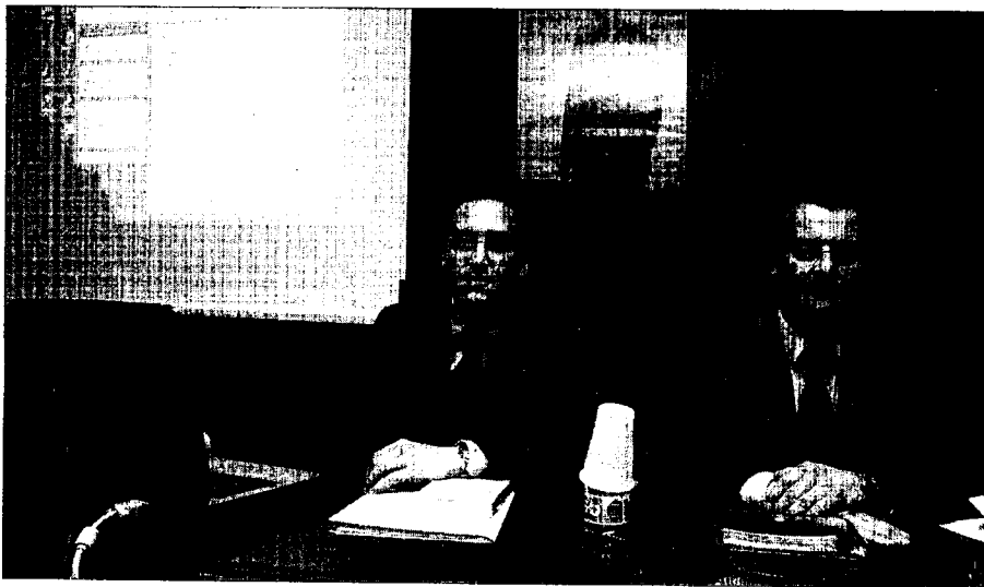
Un momento de la inauguración de las Jornadas, celebrada ayer en el Salón de Actos del TSJ-CLM.