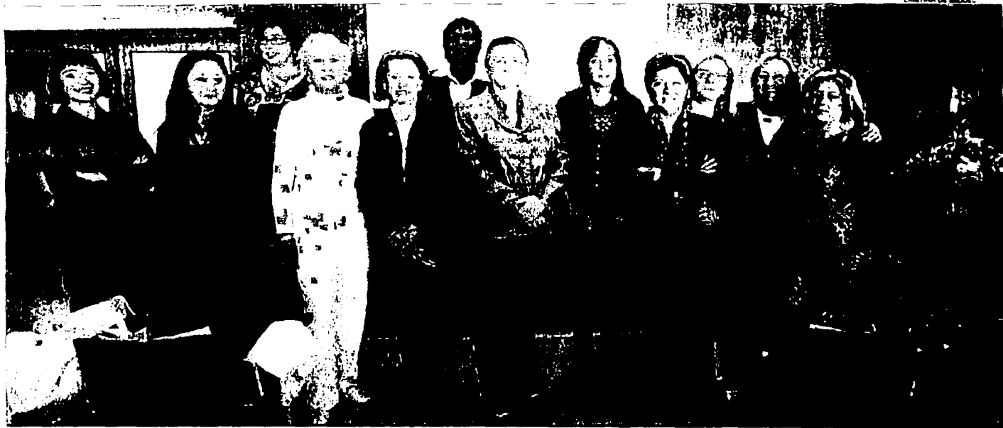
Imagen de las trece mujeres abogadas preconstitucionalistas homenajeadas ayer en el Colegio de Alicante por su pionera trayectoria profesional