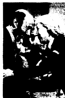
Alfredo Pérez Rubalcaba.

Cerca de 60.000 jóvenes se presentaron a estas últimas pruebas, en las que Interior establecía como exclusión definitiva de las mismas “las enfermedades de transmisión sexual”. “Los tribunales médicos designados para intervenir en las pruebas de acceso al Cuerpo Nacional de Policía consideran el VIH (Virus de Inmunodeficiencia Humana) como una enfermedad inmunológica sistemática que afecta negativamente al siste-