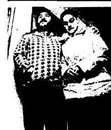
Los padres del menor.