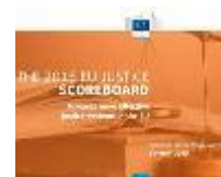
Cuadro de Indicadores de Justicia 2015

La Comisión Europea acaba de publicar la tercera edición del cuadro de indicadores de Justicia. Esta herramienta informativa está dirigida a ayudar a los Estados miembros a mejorar la eficiencia de la justicia facilitando datos objetivos, fidedignos y comparables sobre sus sistemas judiciales en materia civil, mercantil y administrativa. La información se aprovecha en el Semestre Europeo, el proceso de coordinación anual de la política económica de la UE. Junto con las evaluaciones de cada país, el cuadro de indicadores de la justicia en la UE contribuye a determinar las posibles deficiencias y a alentar a los Estados miembros a llevar a cabo, en su caso, reformas estructurales en el ámbito de la justicia. Analiza cuestiones como la eficiencia de los sistemas judiciales, indicadores de calidad (formación, control y evaluación de las actividades judiciales, recurso a encuestas de satisfacción, presupuesto y recursos humanos) o independencia judicial. Respecto a esta última cuestión y en respuesta a preguntas de periodistas sobre la tendencia negativa y recomendaciones específicas para España, la Comisaria de Justicia, Vera Jourova, afirmó que “próximamente la CE estará capacitada para analizar de manera fehaciente los datos en España, ya que la tabla comparativa crece cada año”. Se esperan los primeros resultados comparativos a partir de mayo de este año. Puede acceder al Cuadro de Indicadores 2015 en este enlace y a la rueda de prensa con la Comisaria Jourova aquí .