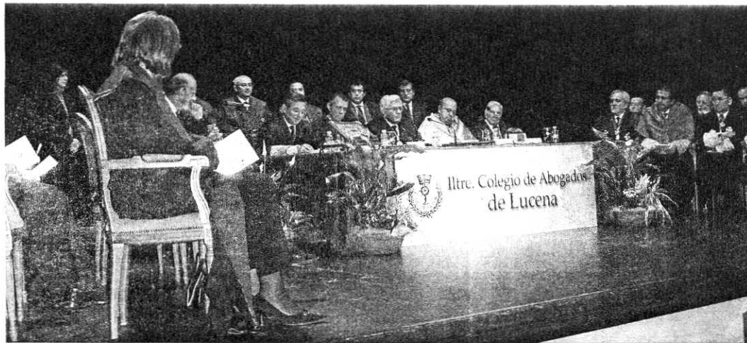
Un momento de la fiesta anual celebrada ayer por el Ilustre Colegio de Abogados de Lucena en el Palacio de Erisana.