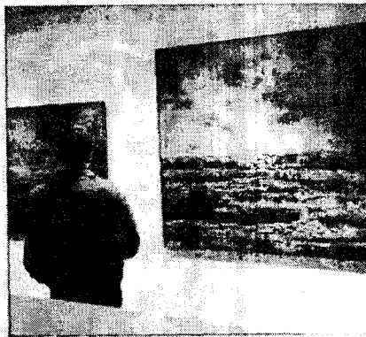
Dos obras de Simón. / LUISMA HALLERAS

No se trata, con todo, de representaciones de marinas reales, sino de trabajadas configuraciones de pintura, a menudo obtenidas mediante la sustracción de materia, en las que Simón ha querido plasmar «las sensaciones que crea un mar de sueños», conforme a una deriva que el propio pintor ha descrito como «un paso de lo espectacular a lo interiorizado».