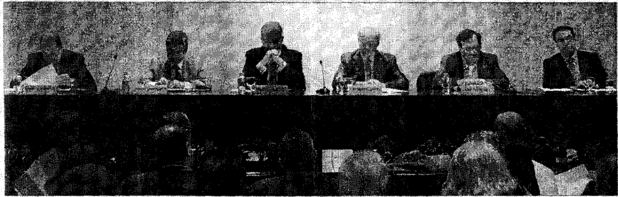
Reunión de representantes de más de 90 colegios profesionales para la firma del manifiesto contra la ley omnibus.

"Los visados y las certificaciones son una garantía colegial de calidad y profesionalidad para el ciudadano"