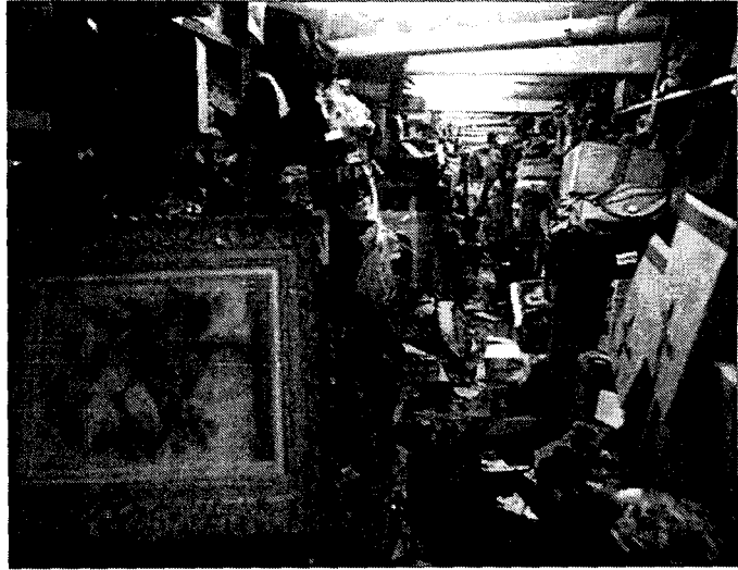
El antiguo depósito de los juzgados de Madrid, en 2002.

También da la razón el Consejo a Félix H. R., a quien robaron una caja fuerte en su casa con 250.000 euros. Con el dinero, los cacos compraron una finca en Tarragona y joyas, parte de las cuales fueron recuperadas. Era 18 alhajas. En 2007, el juzgado ordenó que se le dieran las joyas a la víctima del robo, ocurrido en 2002. Cuando fue a por ellas, las joyas se habían perdido.