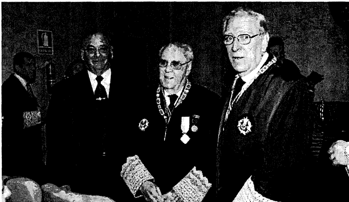
Los tres letrados homenajeados, en el salón de actos del Colegio de Abogados, poco antes de comenzar el acto.