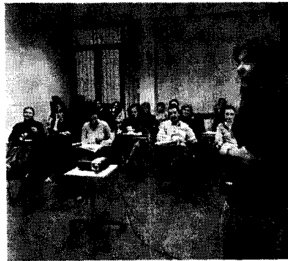
Inauguración del curso de mediación familiar, ayer en el Colegio de Abogados

N. I. El Colegio de Abogados de Elche inauguró ayer la segunda edición del curso especializado en la formación de mediadores familiares, a la espera de que tanto la Conselleria de Justicia como el Consejo General del Poder Judicial concedan las autorizaciones pertinentes para su puesta en marcha, comprometida desde hace meses. Esta prestación tendría que haber comenzado a funcionar el pasado mes de octubre. Pese a los esfuerzos del colectivo de letrados ilicitano, quien se encargó de buscar financiación externa para paliar la falta de fondos expuesta por la administración, la iniciativa continúa bloqueada.