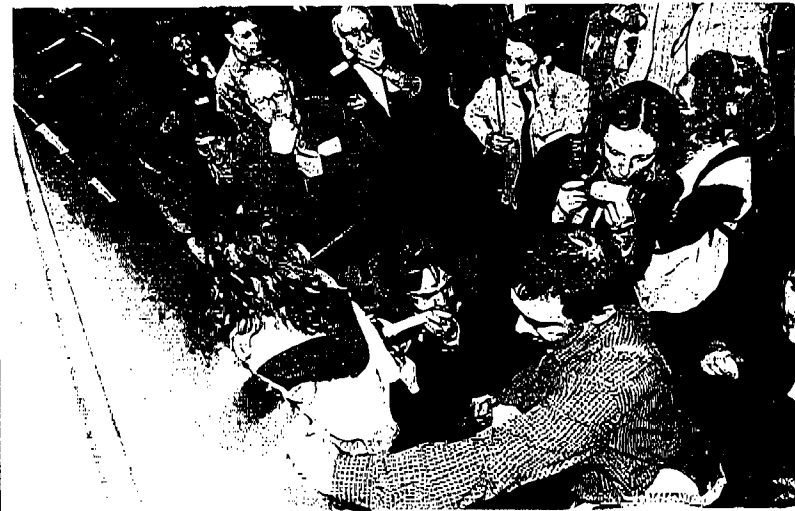
Silbato y aporreos en la sala de vistas

La única sala de vistas donde ayer se intentó celebrar juicios fue la número seis del vestíbulo principal del edificio de la plaza del Pilar. Al final, el ruido ensordecedor de silbato y bocinas, así como los continuos aporreos de puertas y paredes, no le permitieron.