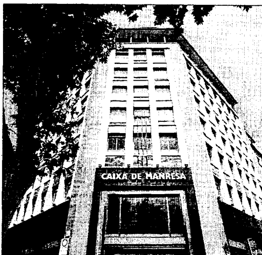
Oficina principal y sede corporativa de Caixa Manresa.