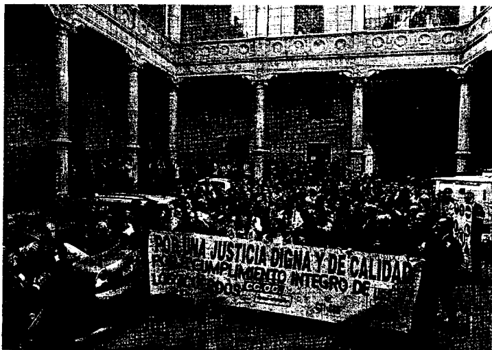
La concentración del pasado 16 de marzo en la Audiencia de Zaragoza volverá a repetirse hoy.

Las organizaciones convocantes tampoco escatimaron críticas hacia UGT, a quien acusan de negociar a sus espaldas. El paro de hoy y mañana tiene carácter general, ya que no sólo se secundará en Aragón, sino también en Asturias, Baleares, Cantabria, Castilla-La Mancha, Castilla y León, Extremadura, La Rioja y Murcia. Es decir, habrá huelga en todas aquellas comunidades que todavía no han recibido las transferencias de Justicia. La capital aragonesa centrali-