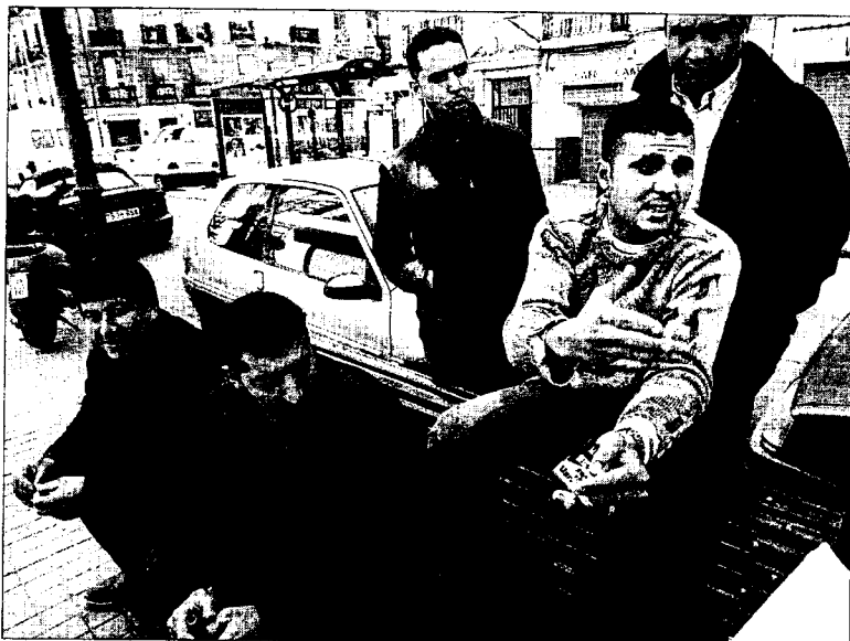
PREISIONADOS. Inmigrantes magrebies conversan en un banco del barrio de Russafa.

■ Tres furgonetas de la Policía arrestaron a 18 personas en Russafa