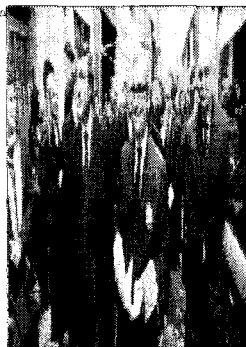
El decano del Colegio de Abogados (centro), junto con otros letrados, durante la movilización que reclamó el pago por el trabajo 'de oficio'.