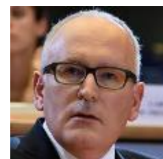
Frans Timmermans, Vicepresidente Primero de la CE, presentó la Agenda en Estrasburgo la semana pasada

La Comisión Europea ha presentado una Agenda Europea de Seguridad para el período 2015-2020 con el fin de contribuir a la cooperación de los Estados miembros en la lucha contra las amenazas a la seguridad y redoblar esfuerzos comunes en la lucha contra el terrorismo, la delincuencia organizada y la ciberdelincuencia. La Agenda establece las herramientas y medidas concretas que se utilizarán en este trabajo conjunto para garantizar la seguridad y responder más eficazmente a estas tres amenazas acuciantes. Los recientes ataques terroristas a ciudadanos europeos y a sus valores se coordinaron a escala transfronteriza, lo que demuestra que debemos trabajar juntos para resistir a tales amenazas respetando plenamente al mismo tiempo los derechos fundamentales. La responsabilidad de garantizar la seguridad interior corresponde en primer lugar a los Estados miembros, pero los retos transfronterizos desafían claramente la capacidad de los distintos países para actuar en solitario, por lo que se necesita la ayuda de la UE para crear la suficiente confianza y facilitar la cooperación, el intercambio de información y la acción común. La nueva forma de trabajar en colaboración en el seno de la Comisión ha permitido un planteamiento integral de la seguridad, y ha permitido incluir en la Agenda medidas correspondientes a todo el espectro de políticas: desde Justicia y Asuntos de Interior hasta Asuntos Financieros pasando por Transporte y Medio Ambiente.