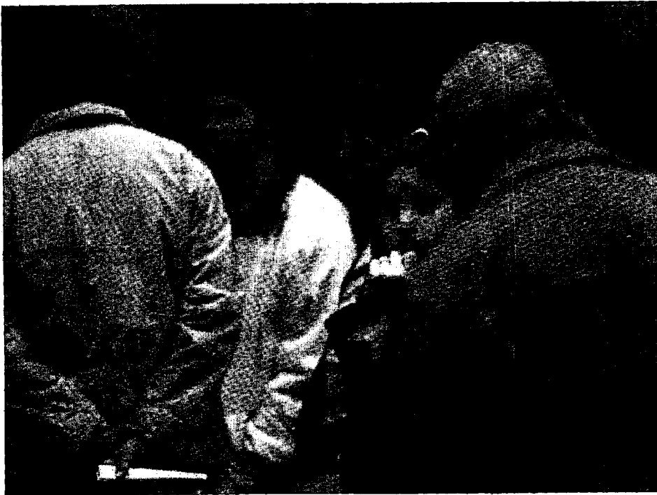
Colas de inmigrantes para conseguir sus documentos en el último proceso de regularización.

Así, el juzgado declara "improcedente" el despido, "toda vez que la [firma] demandada tampoco ha justificado causa alguna que pudiera conllevar la procedencia" de extinguir la relación laboral. Y condena a la empresa a que readmita al trabajador o le indemnice con 95,17 euros, cifra calculada so-