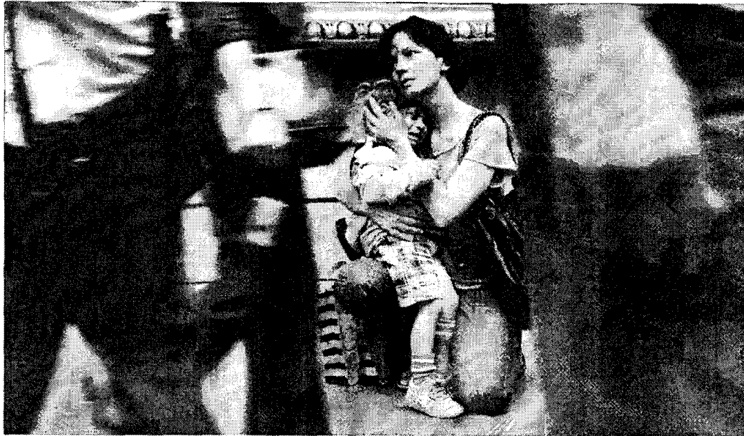
Una madre consuela a su hijo que llora entre el bullicio del Museo del Louvre, en París.