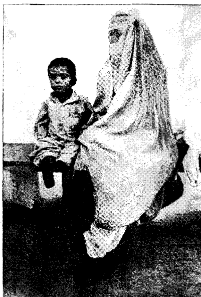
Arriba, 'La montaña de humo', fotografía tomada en un vertedero de basuras de Phonm Phen (Tailandia). A la izquierda, una madre cubierta con un burka espera a que su hijo mutilado sea atendido en un dispensario, en Afganistán.

zadas, realizada por el barcelonés Eugeni Gay Marín en Santiago de Atitlán (Guatemala), cuando el autor encontró un grupo de niños jugando en la calles y les pidió que se hicieran fotografías entre ellos, sin posar, como un juego.