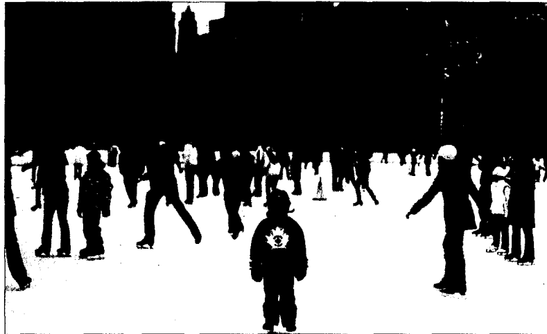
Fotografía de la exposición Fracaso , que puede verse en la Sala de Arte Joven.

» Utopía ecologista. Con el idealista título de Mientras sea posible , la Casa de América presenta hasta el 25 de mayo una exposición colectiva, creada en el mismo interior del edificio por ocho artistas latinoamericanos y españoles sobre la transformación del espacio. Las obras —fabricadas con elementos naturales o reciclados— invitan al público a interactuar con ellas, como la plasmación de deseos en piezas de barro, un huer-