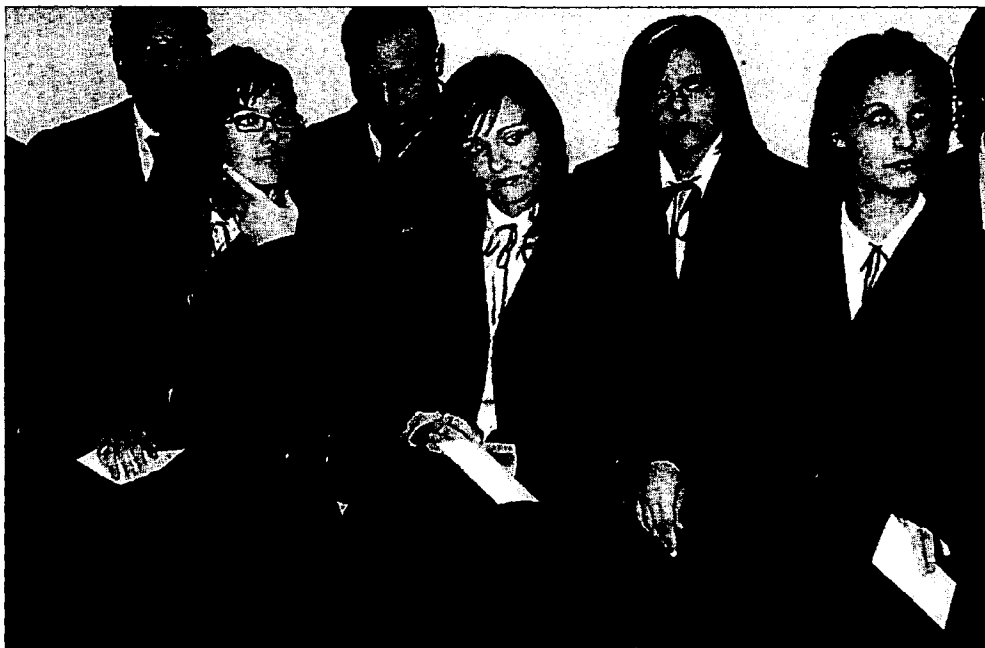
Uno de los nuevos colegiados, recibiendo ayer tarde la toga del Col·legi d'Advocats de Reus.