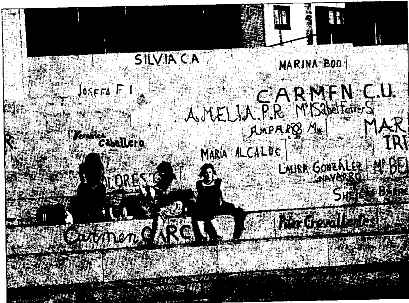
Imagen de la campaña de Amnistía Internacional, con los nombres de las mujeres asesinadas el último año escritos en un muro.

Tras veinte años de vejaciones, una sentencia de la Audiencia de Sevilla permitió una rebaja de la pena y sólo condenó con dos años de cárcel al agresor por instalar un «régimen de terror y sadismo físico y psíquico» con su familia. El juez consideró una rebaja de condena porque el acusado «tiene un carácter impulsivo, escaso control sobre sus componentes hostiles que le hacen persona propia para descargar sus frustraciones sobre personas que sean percibidas por él como débiles o vulnerables».