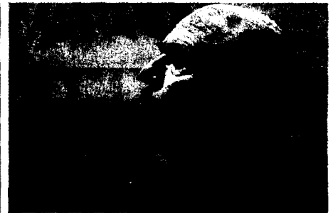
Botín acudirá al Supremo como testigo. FIRMA

Accenture se ha alzado con el primer puesto en la lista Global Outsourcing 100 de la International Association of Outsourcing Professionals, por tercer año consecutivo.