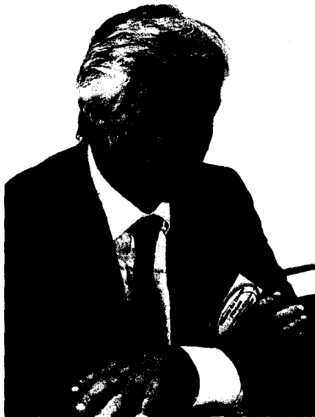
De Oleaga conoció ayer que hay nuevo borrador. V. GONZÁLEZ

A pesar de que falta un año y medio para el desarrollo reglamentario, desde el Ministerio confían en que se van a cumplir los plazos previstos. La aplica-