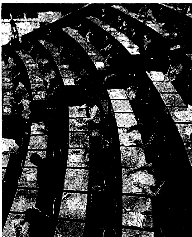
Una prueba en la Facultad de Derecho.

Entrena aseguró que "las universidades tendrán tiempo de adaptarse a la nueva norma y que la prueba se ade-