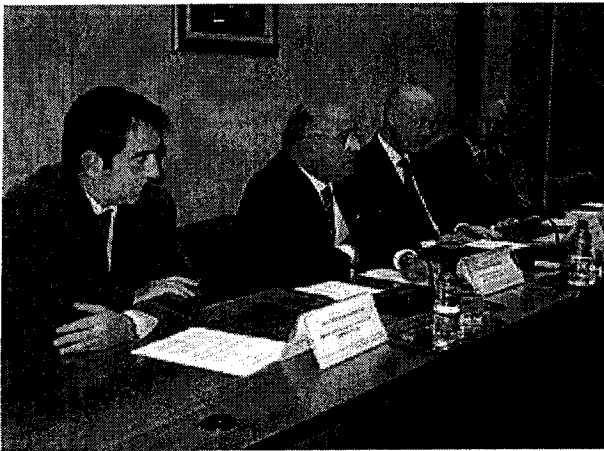
Un momento de la clausura del último master de experto en migraciones internacionales en el CGAE

El Consejo de Gobierno ha aprobado ayer la firma de un convenio de colaboración entre el Gobierno de Aragón, el Colegio de Abogados de Zaragoza la Facultad de Derecho de la Universidad de Zaragoza con el objetivo de mantener el Seminario Permanente en materia de Migraciones Internacionales y Extranjería, en el que también colabora el Consejo General de la Abogacía Española.