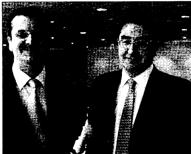
En la tarde de ayer daban comienzo las jornadas del Colegio de Abogados.

Para completar esta iniciativa, se ha previsto la intervención no sólo abogados, sino de representantes de múltiples disciplinas y profesiones que intervienen directa o indirectamente en casos de malos tratos: fiscales, psicólogos, magistrados, policías... «es decir,