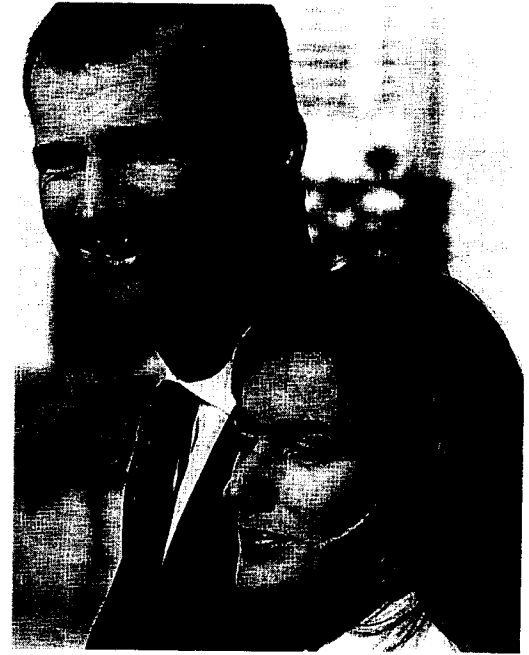
SS.AA.RR. Felipe de Borbón y Letizia Ortiz

Por otro lado, ayer se procedió a la limpieza de la fachada principal del Ayuntamiento, sucia desde finales del pasado mes de abril por los impactos de huevos y pintura durante la huelga de basureros ■