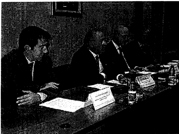
Alumnos y profesores de la última promoción

El Consejo de Gobierno ha aprobado ayer la firma de un convenio de colaboración entre el Gobierno de Aragón, el Colegio de Abogados de Zaragoza la Facultad de Derecho de la Universidad de Zaragoza con el objetivo de mantener el Seminario Permanente en materia de Migraciones Internacionales y Extranjería, en el que también colabora el Consejo General de la Abogacía Española.