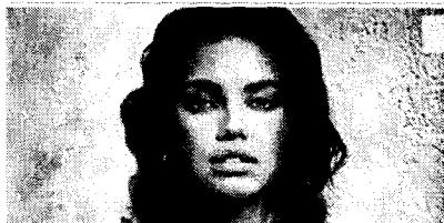
ADRIANA LIMA. EL GLAMOUR RETRO DE AVA GARDNER