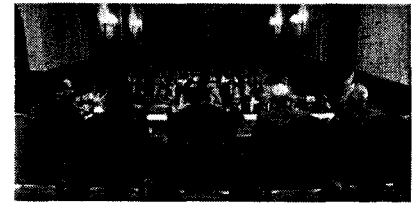
Un centenar de letrados participa en el Congreso de la Abogacía que se inauguró ayer.