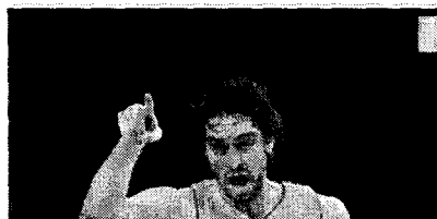
GASOL COMANDA UNOS LAKERS PLETÓRICOS