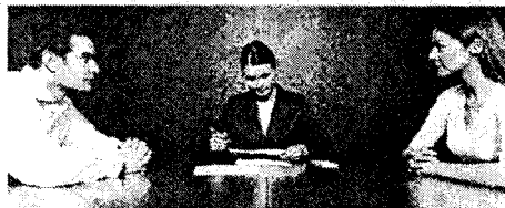
Los problemas jurídicos de las familias.

* Enfoque XXI organiza el próximo miércoles el Seminario sobre Derecho de Familia , que se celebrará en el Colegio de Abogados de La Coruña. El programa incluye diferentes ponencias en las que se tratarán