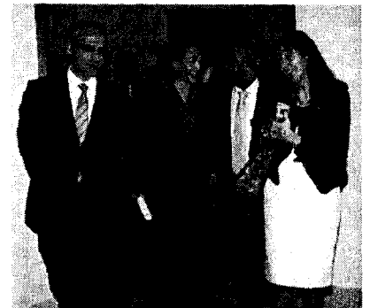
La consejera de Administraciones Públicas clausuró el foro.