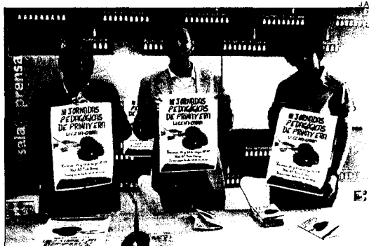
► Un momento de la presentación de las jornadas.

Destacados expertos intervendrán en las actividades que se han preparado al efecto. ■