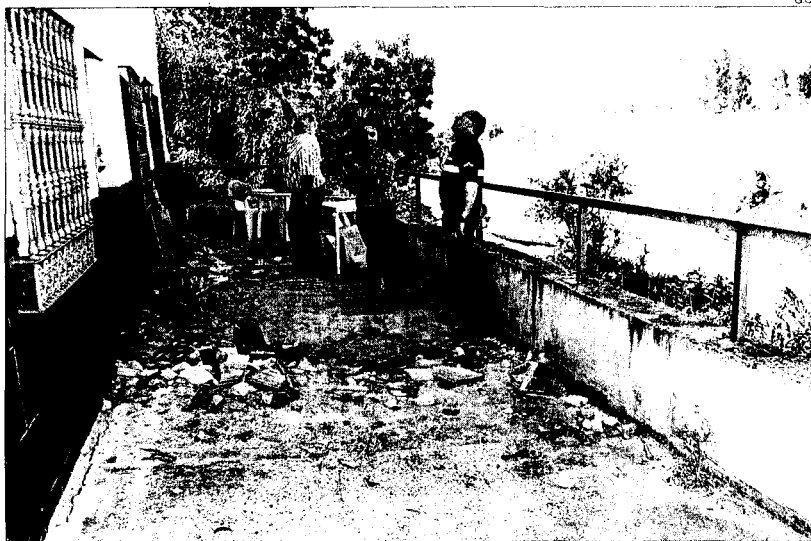
► La Policía Local observa las consecuencias del hundimiento.

PUENTE GENIL NO HUBO QUE LAMENTAR DAÑOS PERSONALES